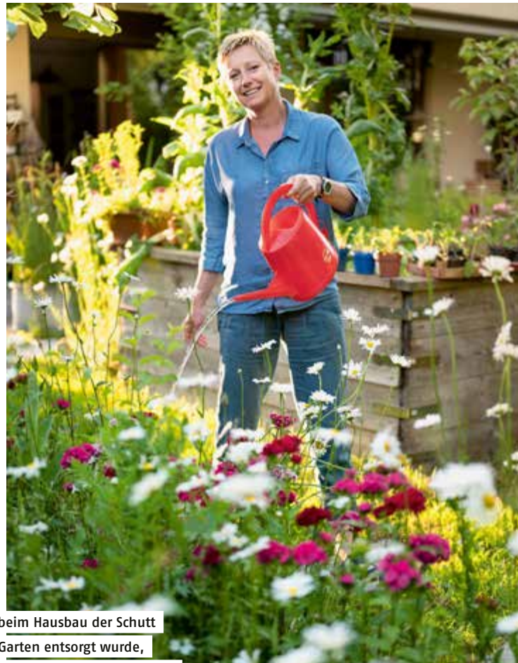
Da beim Hausbau der Schutt im Garten entsorgt wurde, wachsen viele Pflanzen im Topf mit nährstoffreicher Erde.