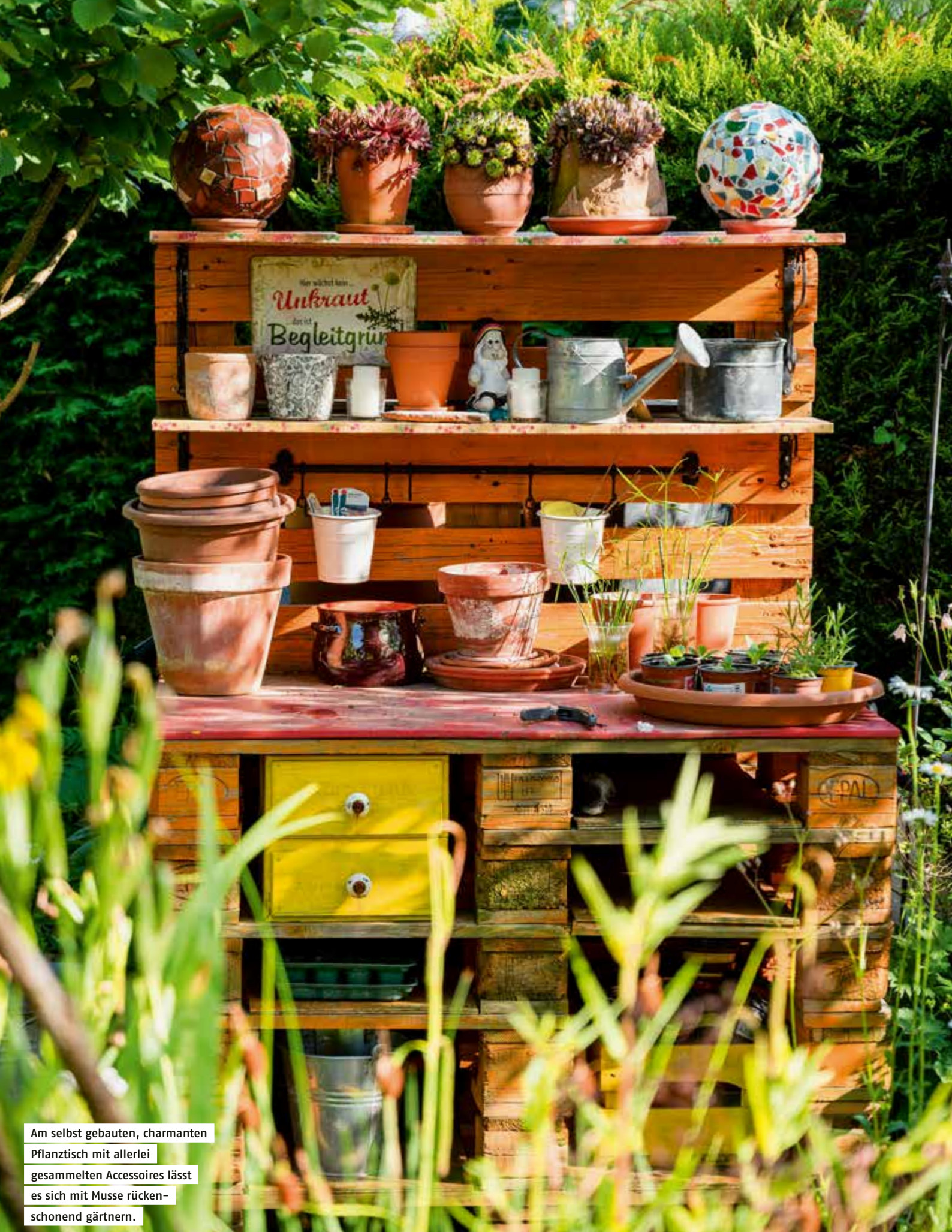
Am selbst gebauten, charmanten Pflanz Tisch mit allerlei gesammelten Accessoires lässt es sich mit Musse rücken-schonend gärtnern.