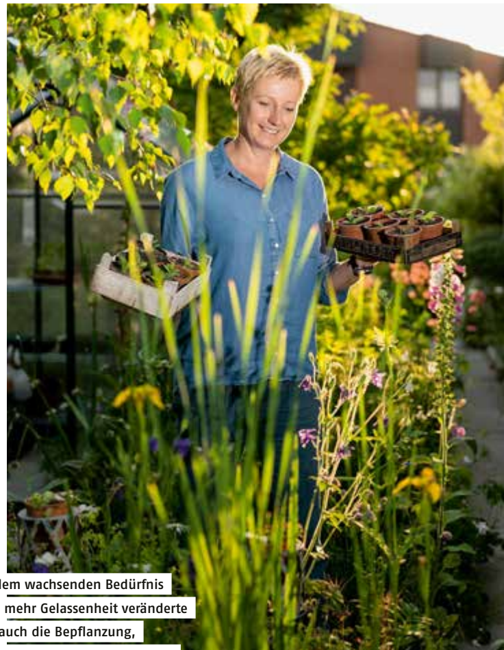
Mit dem wachsenden Bedürfnis nach mehr Gelassenheit veränderte sich auch die Bepflanzung, hin zu mehr heimischen Stauden und Gehölzen.